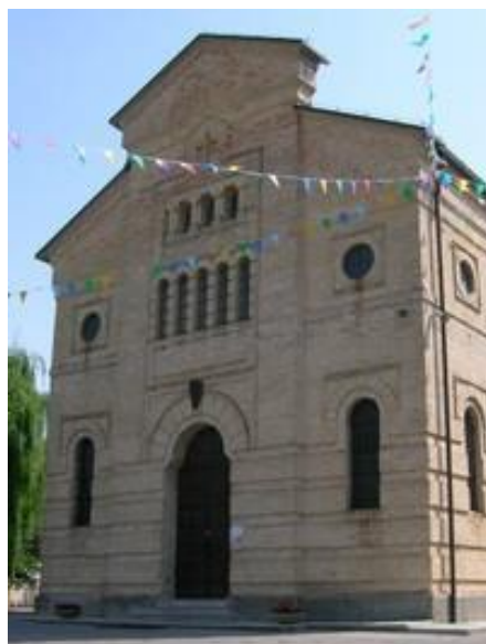
Chiesa di San Giovanni del Tempio

Corso di formazione continua dei servitori-insegnanti nel sistema ecologico-sociale (metodo Hudolin)